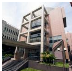
二上講堂 地下会議室