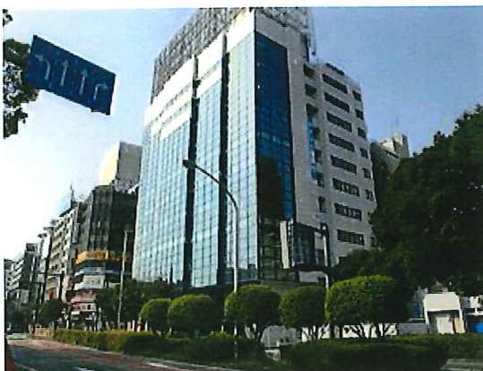
関内駅南口改札を右側に出て前方に見える青い大きなビルです。(写真中央)